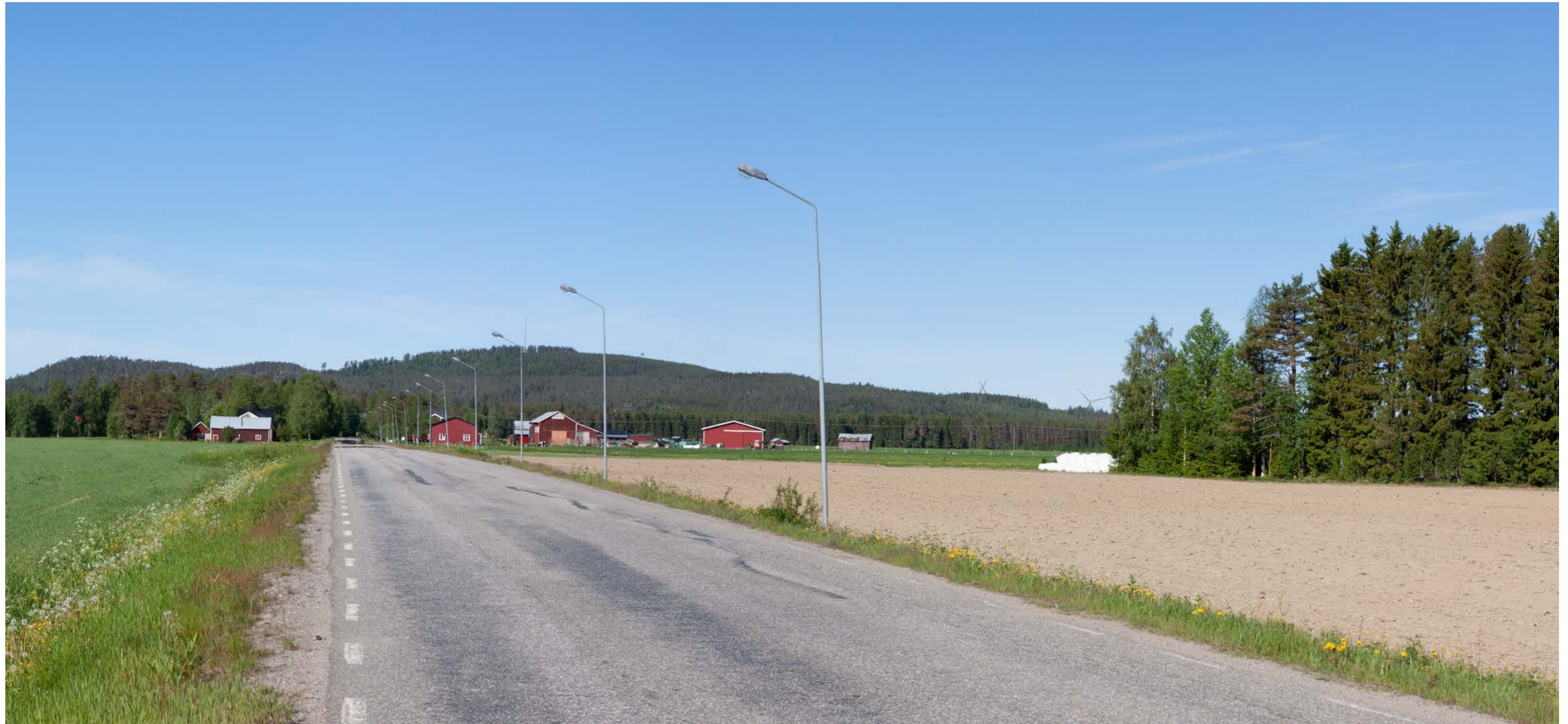
Utsnitt ur cylindriskt panorama. Avstånd till närmaste vindkraftverk: ca 10,6 km. Beträktelseavstånd ca 70 cm.

Kamera: Canon EOS 50D Fotot taget: 2019-06-12 09:00