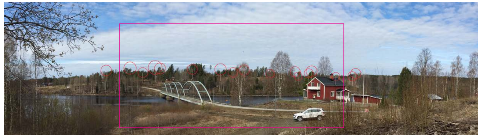
Panorama med vindkraftverken illustrerade som symboler.

Fotomontaget framtaget av Ecogain AB 2019 med hjälp av programvaran WindPRO 3.0.654 av EMD International A/S.