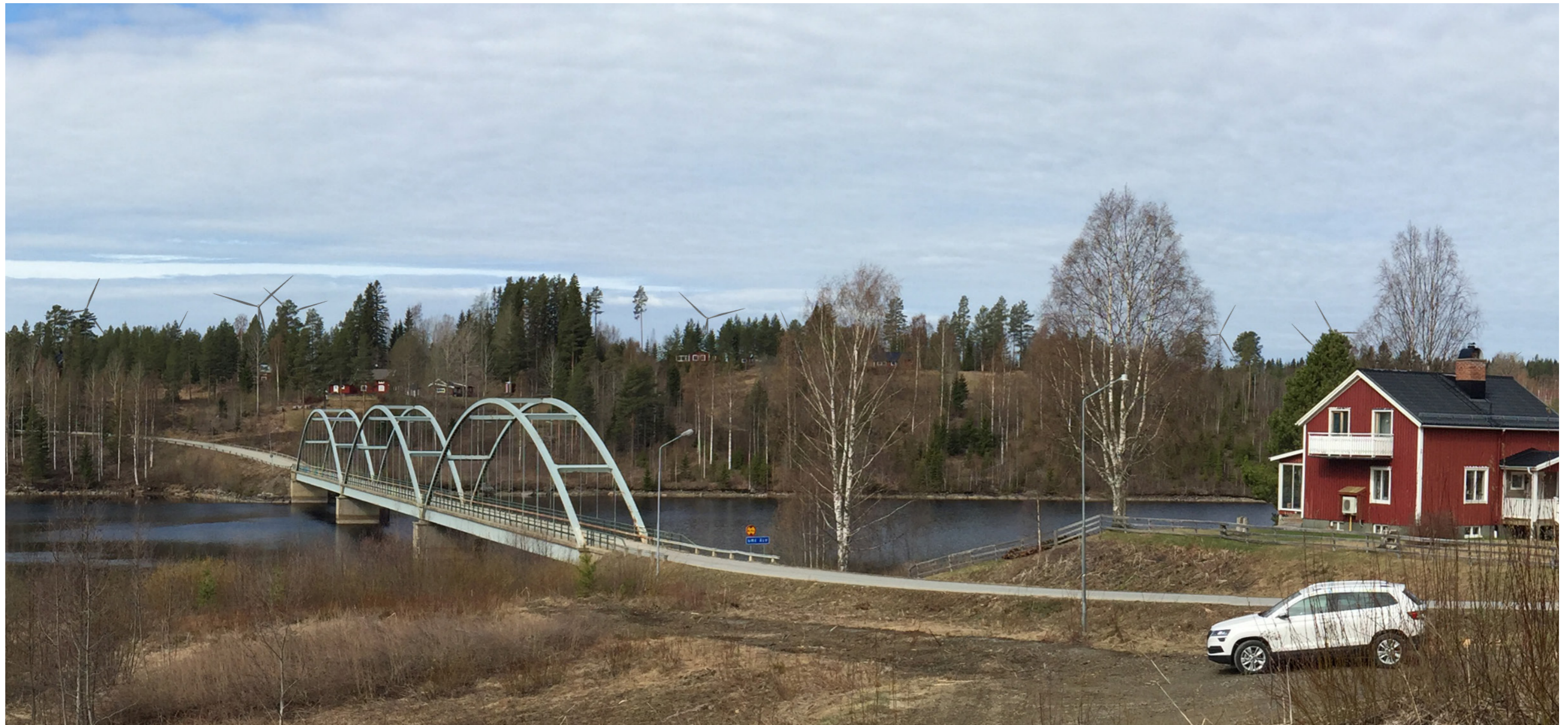
Utsnitt ur cylindriskt panorama. Avstånd till närmaste vindkraftverk: ca 5,1 km. Beträktelseavstånd ca 70 cm.

Fotot taget: 2019-05-10 09:53 Kamera: Canon EOS 50D