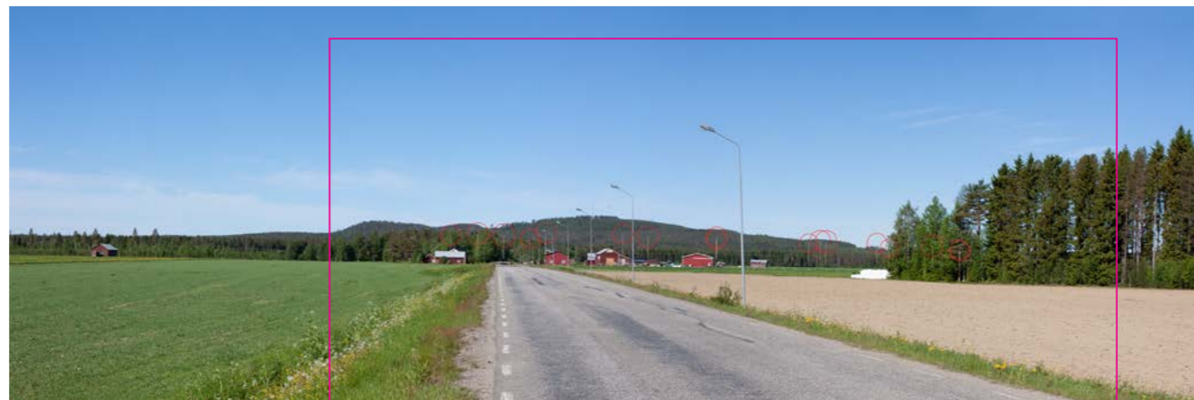
Panorama med vindkraftverken illustrerade som symboler.

Fotomontaget framtaget av Ecogain AB 2019 med hjälp av programvaran WindPRO 3.0.654 av EMD International A/S.