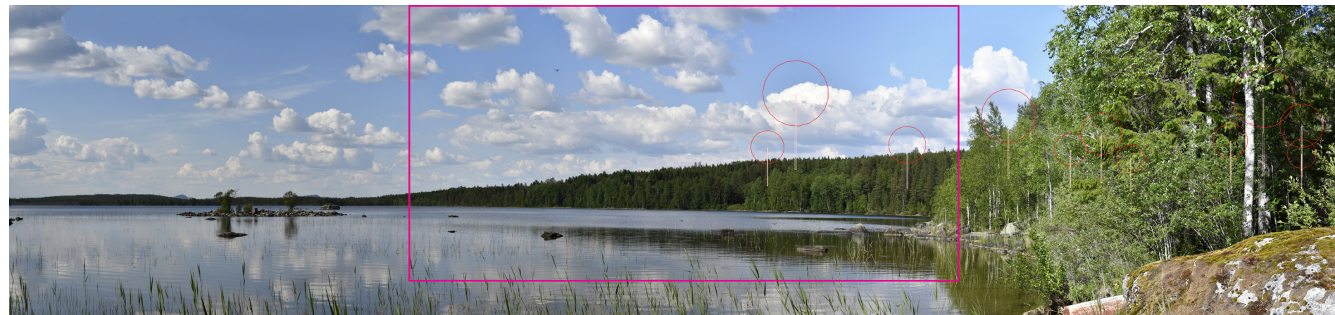
Panorama med vindkraftverken illustrerade som symboler.