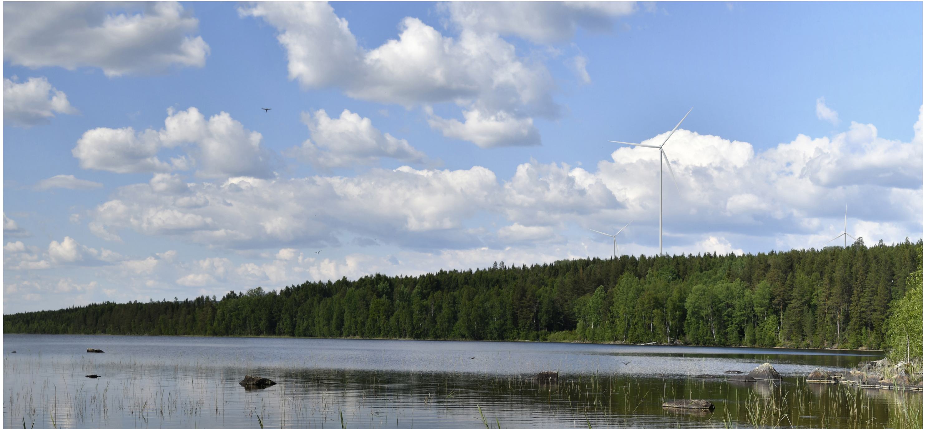
Utsnitt från cylindriskt panorama. Avstånd till närmaste vindkraftverk: ca 1,9 km.

Kamera: Canon EOS 50D Fotot taget: 2019-09-06 10:44 Pixlar: 14750 x 3659