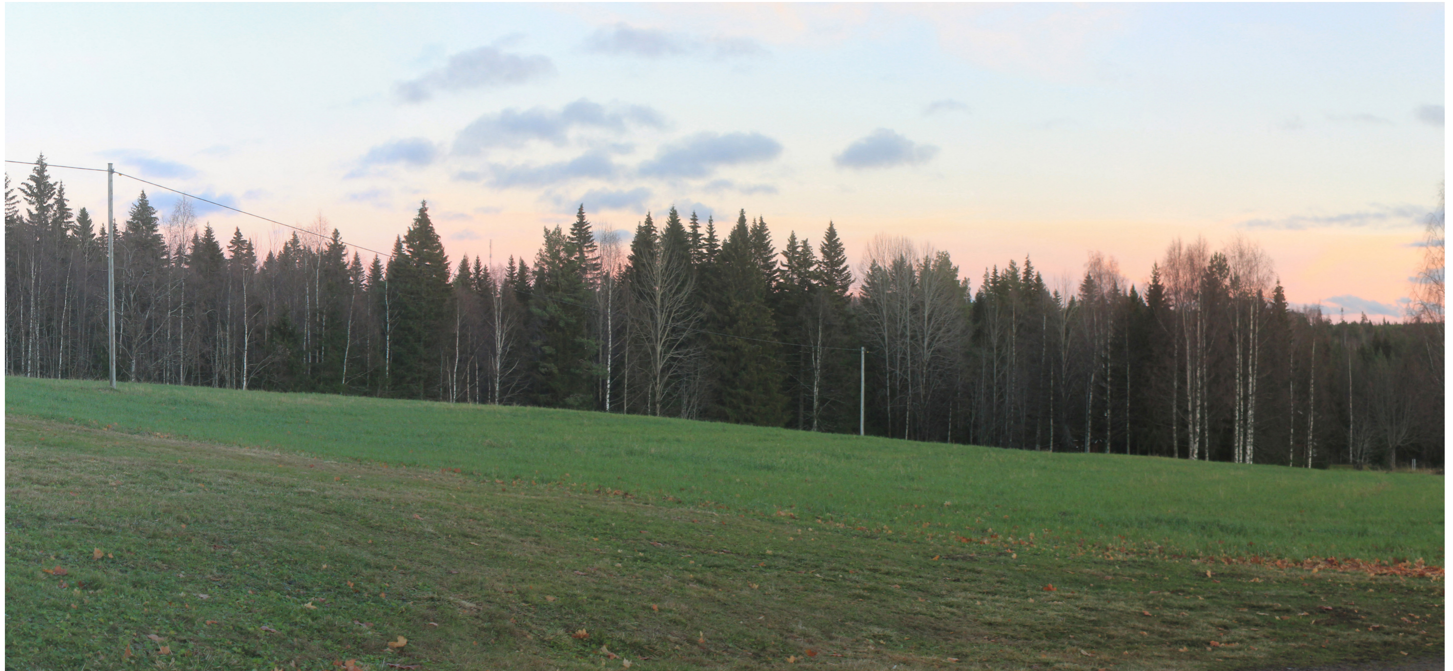
Utsnitt från cylindriskt panorama. Avstånd till närmaste vindkraftverk: ca 5,9 km till närmaste vindkraftverk i projekt Skarpen.

Kamera: Canon EOS 550D Fotot taget: 2021-10-20 19:18 Pixlar: 39304x3601