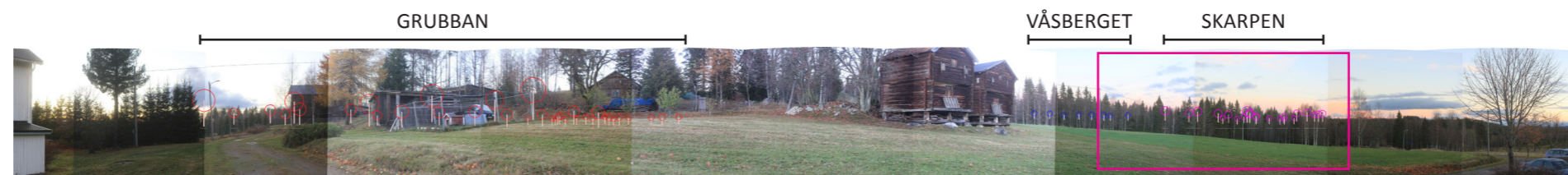
Panorama med vindkraftverken illustrerade som symboler.

Fotomontaget framtaget av Ecogain AB 2021 med hjälp av programvaran WindPRO 3.4.415 av EMD International A/S.