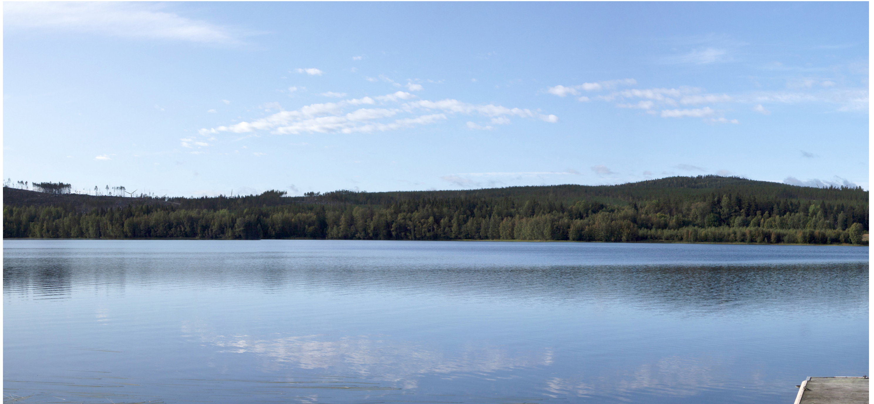
Utsnitt från cylindriskt panorama. Avstånd till närmaste vindkraftverk i projekt Skarpen: cirka 7,9 kilometer.

Kamera: Canon EOS 50D Fotot taget: 2019-09-12 14:17 Pixlar: 13444 x 2904