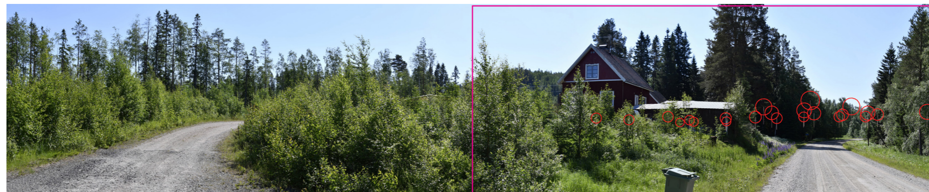
Panorama med vindkraftverken illustrerade som symboler. Den röda rektangeln visar fotomontagets avgränsning.

Fotomontaget framtaget av Ecogain AB 2020 med hjälp av programvaran WindPRO 3.3 av EMD International A/S.