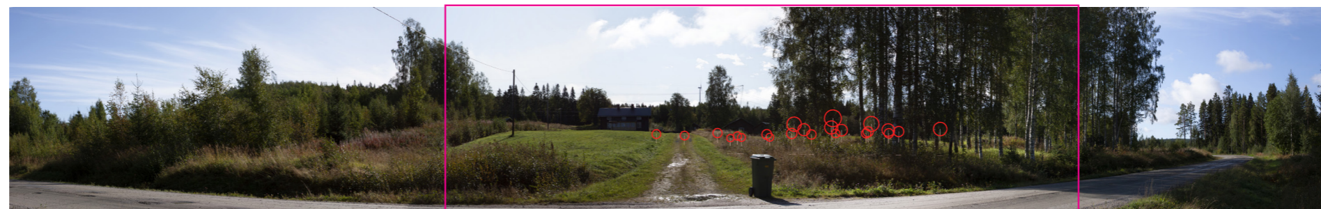
Panorama med vindkraftverken illustrerade som symboler. Den röda rektangeln visar fotomontagets avgränsning.