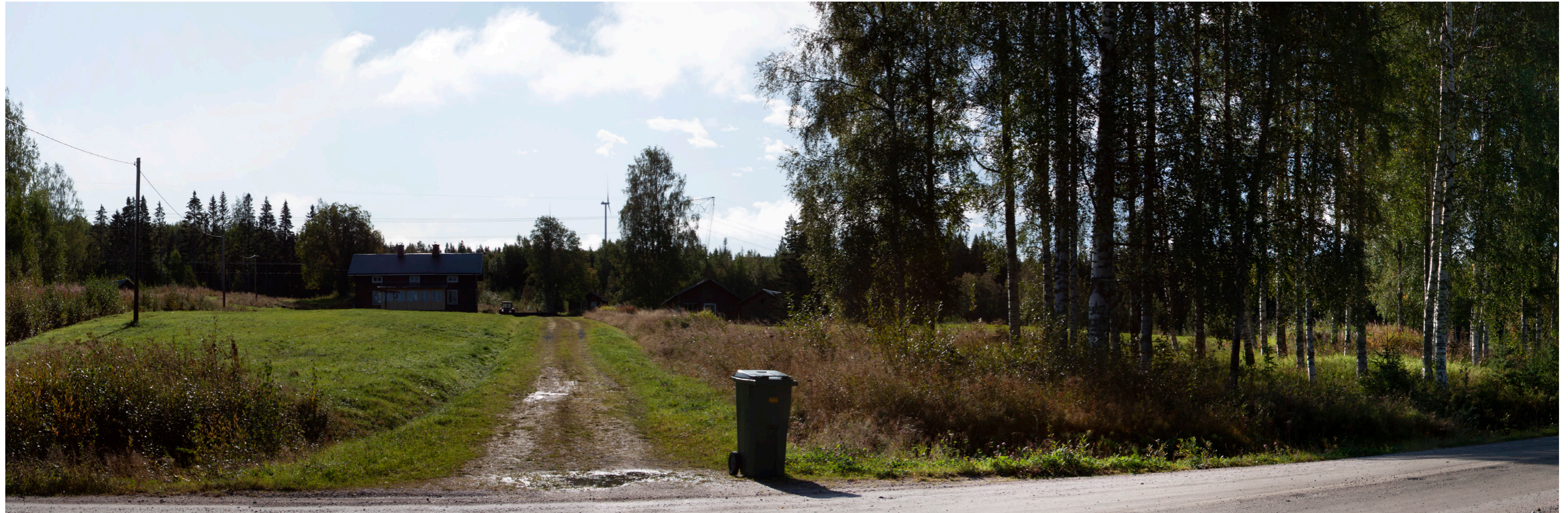
Fotomontage mot sydost från Laforsenvägen i södra delen av Vås. Rekommenderat betraktelseavstånd ca 30 cm. Här syns några av de befintliga vindkraftverken på Våsberget. Alla planerade vindkraftverk för Skarpen döljs av Våsberget. Avstånd till närmaste vindkraftverk (Skarpen): ca 4,8 km.

Kamera: Canon EOS 50D Fotot taget: 2020-06-21